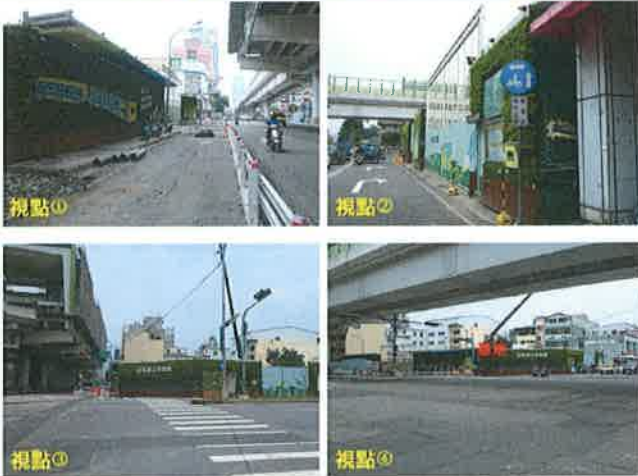
東昇工程顧問有限公司 SUN-RISE ENGINEERING CONSULTANT CO., LTD