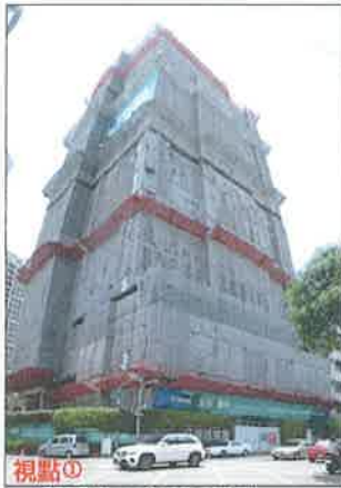
視點① 拍攝日期：107年6月27日