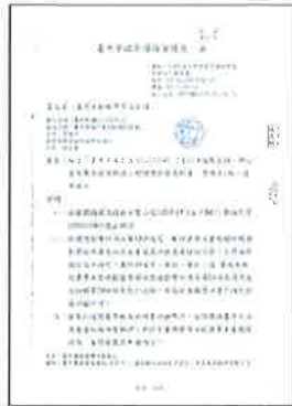
環境影響說明書核備函